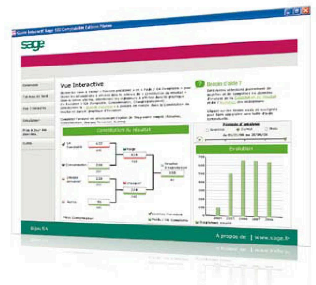
Visualisez votre activité dans Sage 100 Suite Comptable et Financière

A tout moment, l'utilisateur peut passer d'une vue synthétique à l'information détaillée, sans sortir de son analyse en cours.