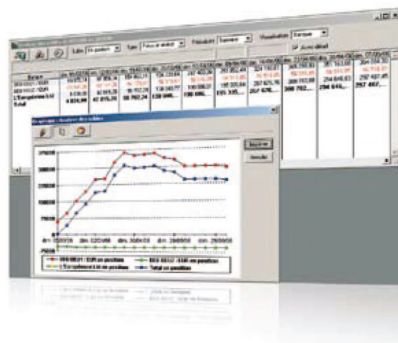
Avec Sage 100 Suite Comptable et Financière, accédez facilement à l'analyse de vos soldes

Pour connaître la situation de vos comptes bancaires en valeur, prévoir votre situation de trésorerie à court et moyen termes et agir sur vos flux financiers, Sage 100 Suite Comptable et Financière comprend des fonctionnalités avancées de gestion de trésorerie : récupération en temps réel des échéances de la comptabilité et des extraits de comptes, saisie des prévisions de trésorerie non encore comptabilisées, situation de trésorerie prévisionnelle, analyse et états de trésorerie.